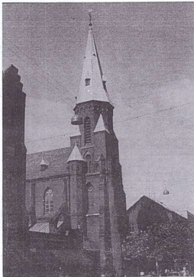
ecclesia beatae mariae virginis immaculatae conceptae