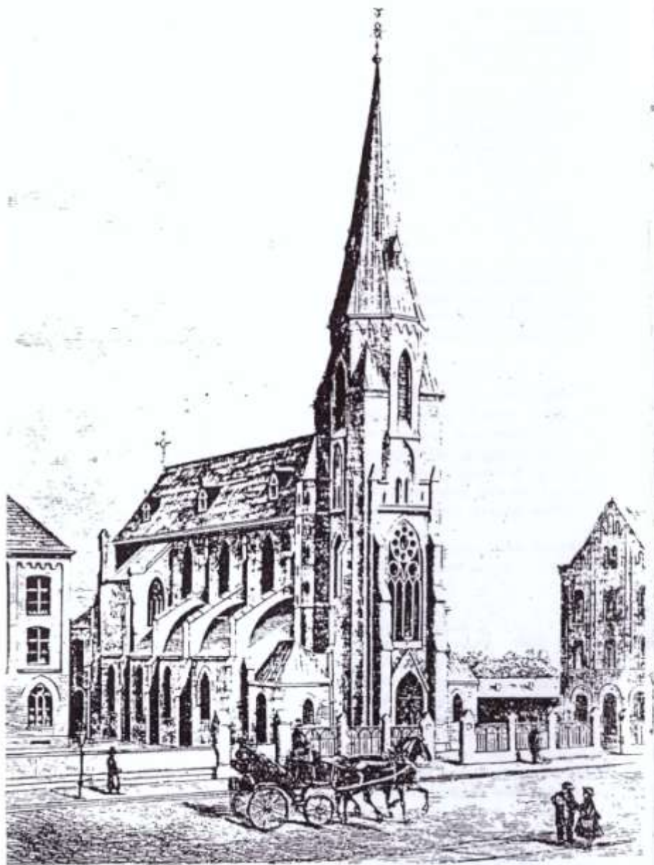
Fra Illustreret Tidende 12/12 1880